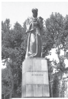
Муҷассасаи Абуалӣ ибни Сино дар ш. Душанбе

Ба шарофати соҳибистиклол гардидани Тоҷикистон нақши ёдгориҳои таърихӣ ва осорхонаҳо дар тарбияи шаҳрвандон сол то сол меафзояд. Хусусан, бо қабул намудан, татбиқ гардидани қонунҳо ва қарорҳои Ҳукумати Ҷумҳурии Тоҷикистон «Дар бораи фарҳанг» (13 декабри соли 1997), «Дар бораи ҳифз ва истифодаи объектҳои мероси таърихӣ фарҳангӣ» (3 марти соли 2006), «Барномаи рушди фарҳанги Ҷумҳурии Тоҷикистон барои солҳои 2008-2015» (3 марти соли 2007), «Дар бораи осорхонаҳо ва фонди осорхонаҳо» (3 июли соли 2012) ва ғайра сатҳи дониш, савияи худшиносӣ, ватандӯстию ватанпарварии шаҳрвандонамон то рафт баланд мегардад. Дар натиҷаи татбиқи ин қонуну қарорҳо дар Тоҷикистон осорхона-мамнӯъгоҳҳо ва навъҳои гуногуни осорхонаҳои замонавӣ бунёд ва ба истифода дода шудаанд.