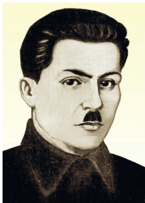
Қаҳрамони Тоҷикистон Шириншоҳ Шоҳтемур

Бо Фармони Президенти Ҷумҳурии Тоҷикистон Эмомалӣ Раҳмон аз 27-уми июни соли 2006 фарзанди бошарафи халқи тоҷик Шириншоҳ Шоҳтемур барои фаъолияти бунёдкорои давлатдорӣ ва хизматҳои бузургаи дар поягузори Истиқлолияти давлатии Ҷумҳурии Тоҷикистон бо унвони оли «Қаҳрамони Тоҷикистон» сарфароз гардид.