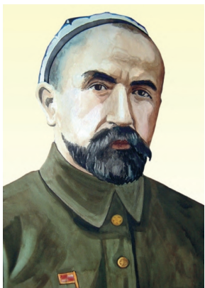
Кахрамони Тоҷикистон Нусратулло Махсум

Нусратулло Махсум 1 июли соли 1881 дар деҳаи Чашмаи Қизилии ноҳияи ҳозираи Рашт (Ғарм)-и Ҷумҳурии Тоҷикистон, дар оилаи деҳқон таваллуд ёфтааст. Барои бехтар намудани ҳаёти иқтисодии хонаводагӣ ва шинос шудан бо вазъи иҷтимоию сиёсии дигар мавзёҳои Осиеи Миёна чун коргар дар яке аз корхонаҳои Хӯқанд аз соли 1895 то 1906 кор мекунад. Барои дар ҳаракати коргарӣ иштирок кардани аз кор ронда мешавад. Ў ба зодгоҳаш баргашта, то сарнагун шудани аморати Бухоро (с.1920) дар заминҳои сарватмандон ба деҳқонӣ