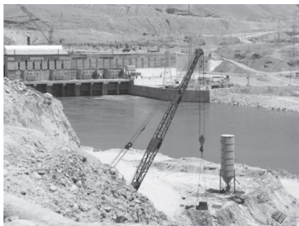
Сохтмони Неругоҳи барқи оби "Роғун"

Ҳукумати мамлакат чихати васеъ намудани ҷуғрофияи ҳамлу нақли молу маҳсулот, баланд бардоштани сифати хизматрасониҳои нақлиётӣ ва аз бунбасти коммуникатсионӣ