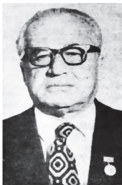
Аввалин ректори Донишгоҳи миллии Тоҷикистон, академик З. Ш. Раҷабов

Омӯзгорони лаёқатманд дар Донишкадаи омӯзгории Самарқанд тайёр карда мешуданд. Соли 1948 Донишгоҳи давлатии Тоҷикистон ташкил ёфт, ки он саҳми худро дар рушди маориф то ҳол бомуваффақият мегузорад.