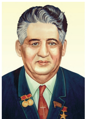
Қаҳрамони Тоҷикистон, академик, Шоири халқи Тоҷикистон Мирзо Турсунзода

Дар Фармони Президенти Ҷумҳурии Тоҷикистон Эмомалӣ Раҳмон аз 7 майи соли 2001 омадааст: «Барои хизматҳои бузург ва матонат дар бунёди пояҳои Истиқлолияти Ҷумҳурии Тоҷикистон, инкишофи адабиёт, фарҳанг ва тарғиби гоҳҳои сулҳ, дӯстии халқҳо ва густариши нуфузи байналмилалии Тоҷикистон ба фарзанди шарафманди халқи тоҷик Мирзо Турсунзода унвони «Қаҳрамони Тоҷикистон» дода шавад».