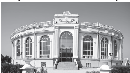
Бинои амфитеатр дар Душанбе

Фарҳанг – ҳастии миллат. Бо ташкилҳои Тоҷикистони соҳибистиклол, сарфи назар аз мушкилиҳои давраи гузариш, дар ҷумҳурӣ консепсияи давлатӣ оид ба рушди фарҳанг таҳия шуда, назария ва амалияи он ба тариқи мушаххас муайян гардидааст.