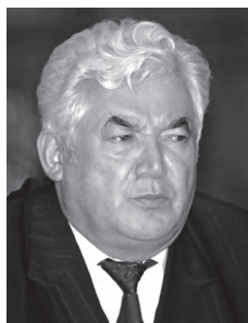
Ходими давлатию чамъиятӣ Раҳмон Набиев

Ҳарчанд ба вазифаи Раиси Шӯрои Олӣ Раҳмон Набиев 1 интихоб шуда, баҳри аз байн нарафтани ҷумҳурии соҳибистиклол роҳи мусолиҳаро пеш гирифта бошад ҳам, гирдиҳамоиҳои ғайриқонунӣ авзои мамлакатро торафт ноором мегардонанд. Вазъият чунон мураккаб гардид, ки Р.Набиев мачбур шуд дар арафаи интихоботи президентӣ ваколатҳои Раиси Шӯрои Олиро боздорад. Ва ниҳоят, 24 ноябри соли 1991 ба таври раӣпурсии умумихалқӣ Р.Набиев Президенти мамлакат интихоб шуд.