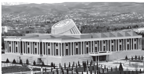
Осорхонаи миллии Тоҷикистон

шаҳрванд саҳми босазо мегузоранд. Чашнгирии маъракаҳои