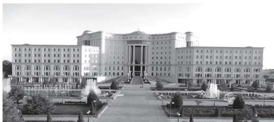
Китобхонаи миллии Тоҷикистон

сершумор татбиқи нуктаҳои барномавии Конститутсияи мамлакат амал намуда, кори тарбиявии шаҳрвандонро дар самти ташаккули рӯҳияи ватанпарастӣ, ахлоқи хамида,