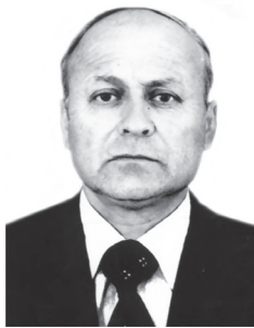
Аълочи маорифи Чумхурии Тоҷикистон Маҳмадзоҳид Ғиёсов

зо кардаанд. Масалан, яке аз омӯзгорони пуртачриба, директори мактаби миёнаи рақами 1-и ноҳияи Мастчоҳ, сипас роҳбари шуъбаи маориф, Аълочи маорифи Чумхурии Тоҷикистон М. Ғиёсов дар ноҳияи Мастчоҳ ташаббускори ташкил намудани бригадаҳои истеҳсолии мактаббачагон гардид. Ин бригадаҳо саҳми арзандаи худро дар ғани гардондани хирмани пахтаи чумхурӣ гузоштанд. Бидуни мушкилӣ ва камбудихо чунин бригадаҳо дар тарбияи меҳнатии насли наврас нақши мусбат бозиданд.