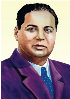
Қаҳрамони Тоҷикистон, академик Бобочон Ғафуров

Бо Фармони Президенти Ҷумҳурии Тоҷикистон Эмомалӣ Раҳмон 8-уми сентябри соли 1997 барои хизматҳои бузург ва фидокориҳо дар поягузори Истиқлолияти Тоҷикистон, рушди тамаддун ва ҳудудиносии миллӣ ба фарзанди бошарафи халқи тоҷик Бобочон Ғафуров унвони олии «Қаҳрамони Тоҷикистон» дода шуд.