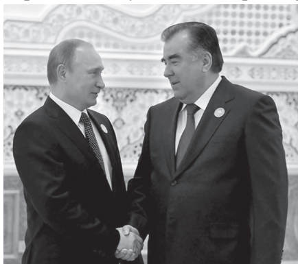
Воҳӯрии Президенти Ҷумҳурии Тоҷикистон Эмомалӣ Раҳмон бо Президенти Федератсияи Русия Владимир Путин

ва ди- гар объектҳои саноати кимиё, металлургия, мошинсозӣ маблағҳои калон ҷудо кард. Танҳо дар тӯли солҳои 2006–2012 бо ҷалби сар- мояи дохилию хориҷӣ 430 корхона бунёд карда шуд. Як гурӯҳ сармоягузори хориҷӣ сармояи худро ба рушди саноати ҷумҳури гузошта, дар истехсоли тиллои Панҷакент, маҳсулоти абрешимии Хучанд ва ғайра ширкат меварзанд.