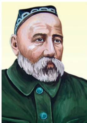
Қаҳрамони Тоҷикистон, аввалин Президенти Академияи илмҳои Ҷумҳурии Тоҷикистон Садриддин Айнӣ

Барои хизматҳои бузург ва фидокориҳои дар поягузори Истиқлолияти Тоҷикистон, рушди тамаддун ва худшиносии миллӣ бо Фармони Президенти Ҷумҳурии Тоҷикистон Эмомалӣ Раҳмон аз 8-уми сентябри соли 1997 ба фарзанди бошарафи халқи тоҷик Садриддин Айнӣ унвони олии «Қаҳрамони Тоҷикистон» дода шуд.