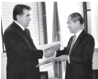
Дабири кулли ЮНЕСКО Коитиро Матсуура ба Президент Эмомалӣ Раҳмон медали тиллоӣ супурда истодааст. Париж, октябри соли 2005

Дар Ҷашнвораи 19-уми байналмилалӣ «Баҳори апрел» (с.2002) дар шаҳри Пхеняни Ҷумҳурии Халқии Корея санъаткорони тоҷик иштирок намуда, дар байни хунарпешагони 46 давлати ҷаҳон ҷойҳои намоёнро ишғол карда, соҳиби ҷомҳои тиллоӣ ва нуқрагин гаштанд. Театри давлатии драмаи русии ба номи В. Маяковский дар фестивали театрҳои драмавии русии Иттиҳоди Давлатҳои Мустақил ва соҳили Баҳри Балтик иштирок намуда, бомуваффақият хунарнамоӣ кард.