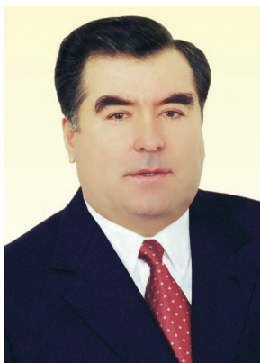
Қаҳрамони Тоҷикистон, Президенти Ҷумҳурии Тоҷикистон Эмомалӣ Раҳмон

Эмомалӣ Раҳмон 5 октябри соли 1952 дар ноҳияи Данғара, дар оилаи деҳқон таваллуд шудааст. Падар ва модар фарзандони худ, аз ҷумла Эмомалиро дар рӯҳияи меҳнатдӯстӣ, садоқат ба Ватан, инсондӯстӣ ва хоксорӣ тарбия кардаанд.