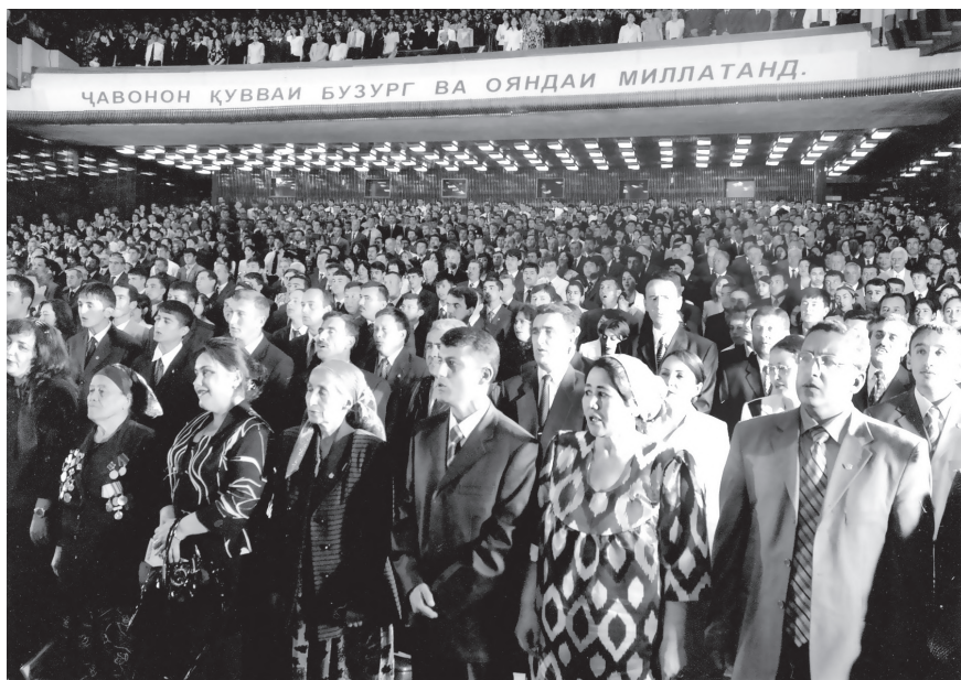
Таҷлили Рӯзи ҷавонони Тоҷикистон

«Чавонон – созандагони фардои ҷомеа» (Душанбе, 2009), барномаи стратегии сиёсати давлатии насли наврас мебошанд. Хусусан, вохӯриҳои ҳарсолаи Президенти Ҷумҳурии Тоҷикистон Эмомалӣ Раҳмон бо ҷавонони мамлакат боиси амалан ба пояи стратегии давлатӣ ва амнияти миллии кишвар гузошта шудани масъалаи ҷавонон гардид.