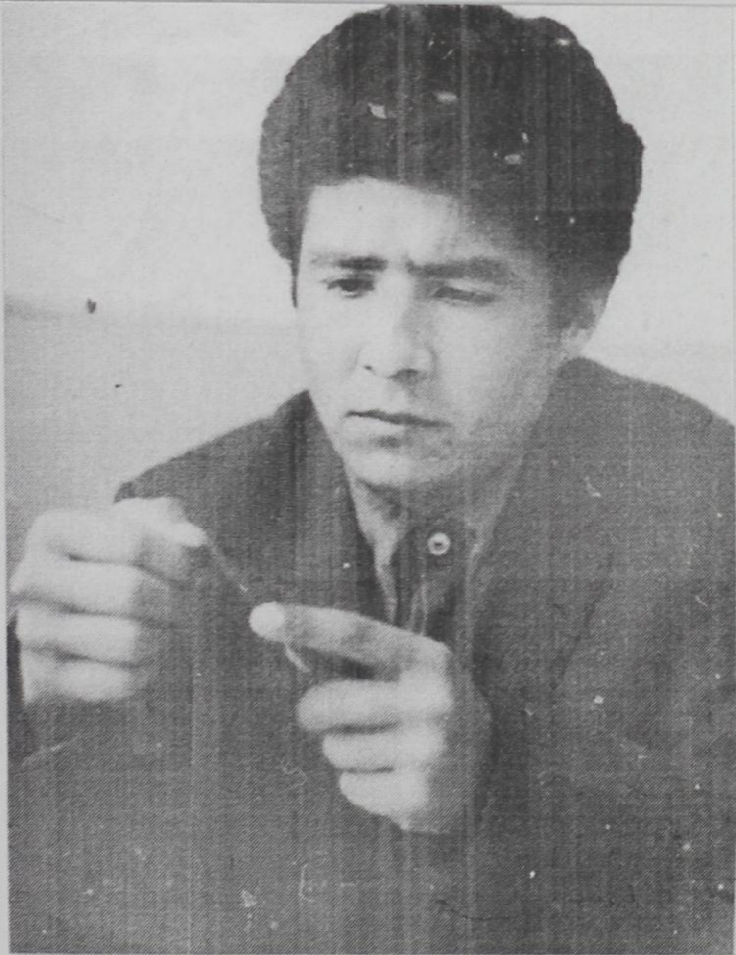
Банда дар рузномаи Комсомоли Тоҷикистон” с 1969