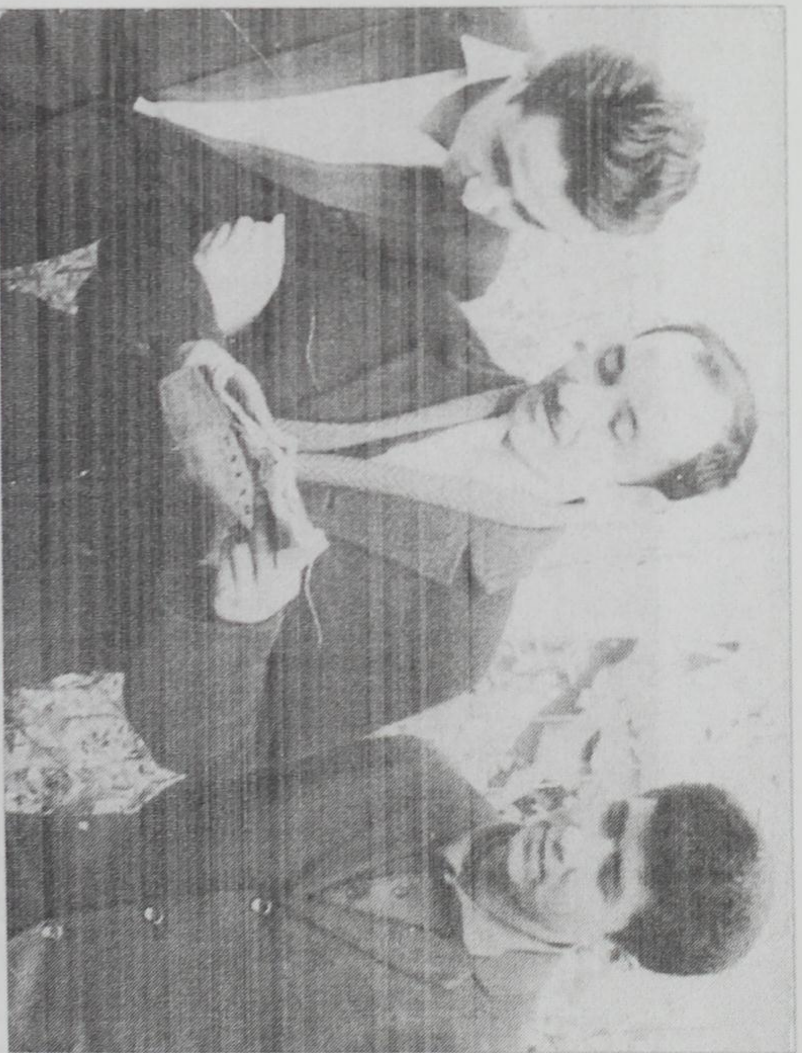
Бо шопирони кулолӣ Ва Саррвар