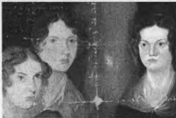
Шарлотта, Эмили ва Энн Бронте

аз маргаш «Ёддоштҳо»-яшро навишт барои аҳли оила ва пайвандонаш. Вале овозаи асар зуд паҳн гардид. Н.Некрасов барои чопаш мароқ зоҳир кард. Аммо писари Мария Михаил Волконский «Ёддоштҳо»-ро асари оилавӣ ҳисобида, танҳо як қисмашро барои Некрасов қироат намуд. «Ёддоштҳо» танҳо соли 1904 аз чоп баромад ва хонандагонро мафтун сохт.